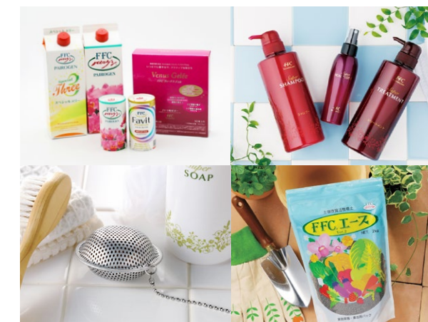
FFCテクノロジーから誕生した各種FFC製品

FFCテクノロジーとは赤塚植物園グループが開発した、水を改質活性化する技術のことで、パイロゲンをはじめとするFFC製品にはこの技術が応用されています。FFC製品は家庭や各種産業で利用され、健康・環境・経済の改善に役立てられています。